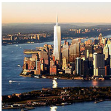
Die US-Metropole New York ist Anziehungspunkt für Immobilienkäufer.