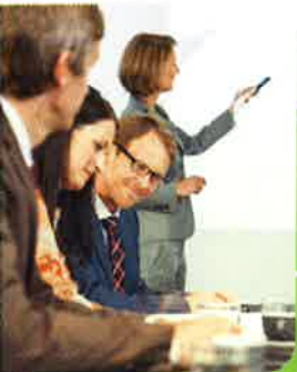
Frank Meinhold Leiter Verlag/TeleTax/TeleLex